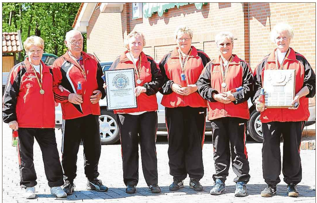
Ganze drei Meter Vorsprung hatten die Frauen IV aus Burhufe im Ziel. Doch das war den erfahrenen Werferinnen egal, als sie die Meisterplakette in den Händen hielten.