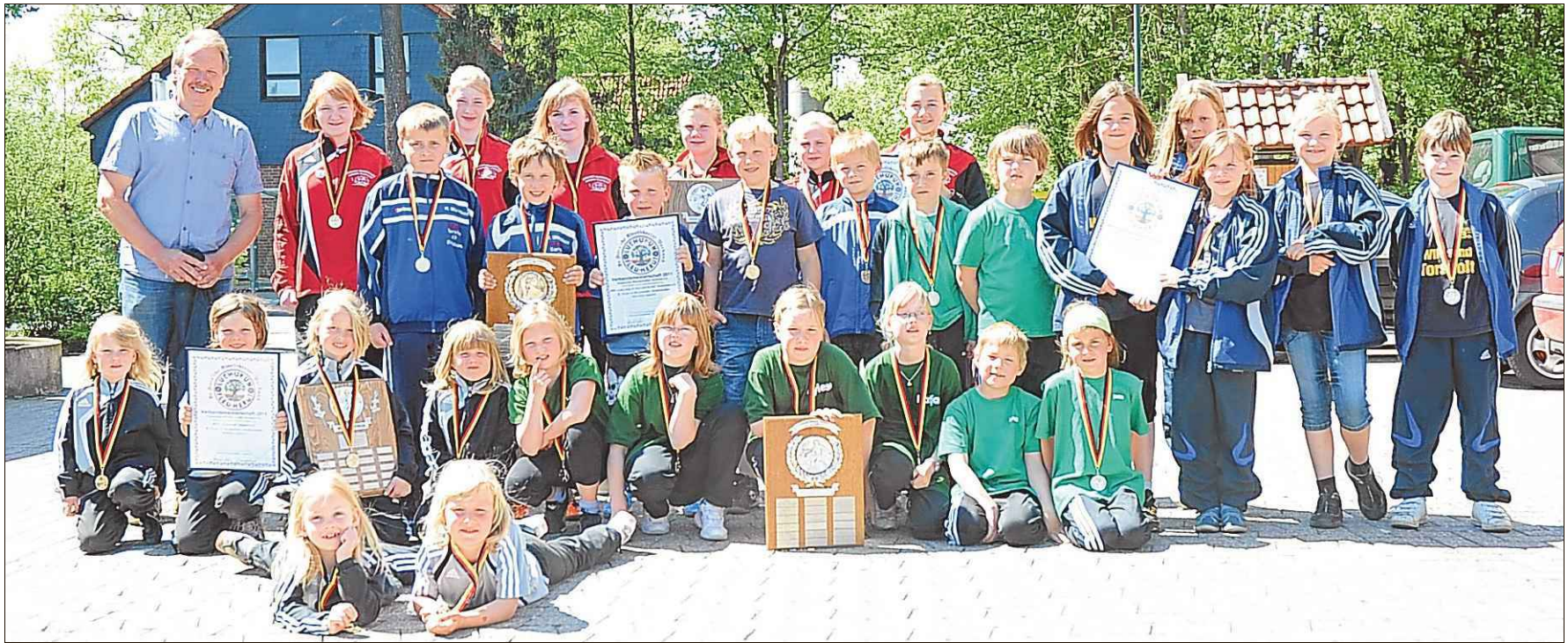
Starken Nachwuchs boten auch in diesem Jahr wieder viele Vereine zu den Titelkämpfen auf. Meister und Vizemeister brachten so manch einen alleingesehenden Friesensportler mit ihren Würfeln zum Staunen.