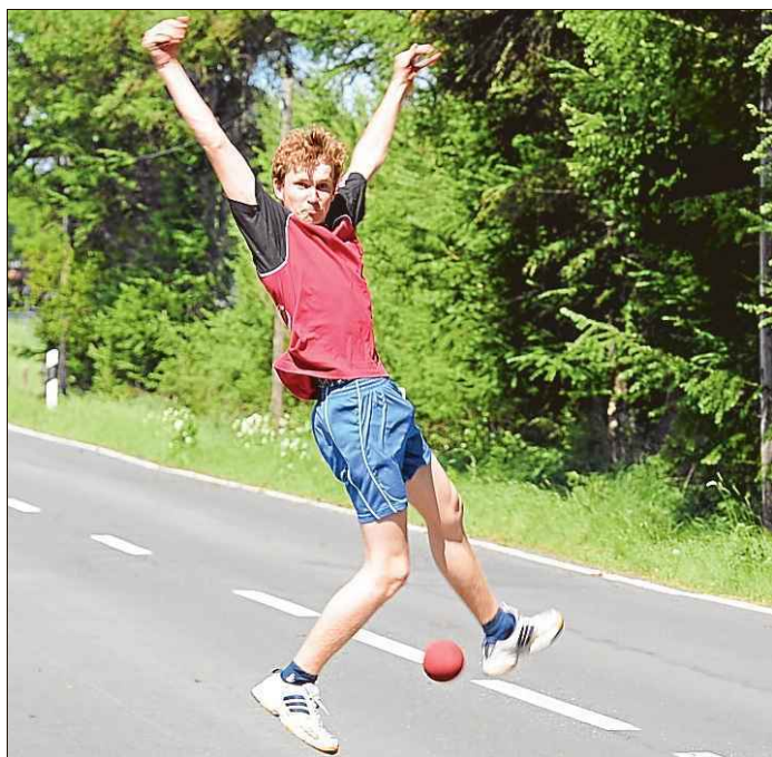
Im Wettbewerb der A-Jugend kamen die Burhafer mit dem starken Seitenwind gut klar.

Im Wettbewerb der Männer II beeindruckte der Oldenburgische Landesmeister aus Halsbek den ostfriesischen Titelträger aus Westeraccum mit brillantem Boßelsport. Halsbek steigerte sich im Verlaufe des Wettkampfes und brachte Westeraccum eine deutliche Niederlage von sieben Wurf bei.