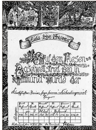
Links: Siegerurkunde vom ersten „Friesenboßelwettstreit“ 1920 in Wittmund, die vom Klootschießerverein Neuharlingersiel gewonnen und vom damaligen Landrat des Kreises Wittmund, Max Schramm, persönlich unterzeichnet wurde.