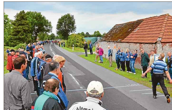
Zahlreiche Käkler und Mäkler säumten den Rand der Wurfstrecke.