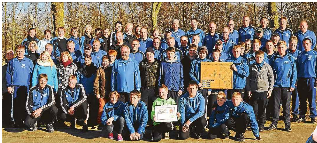
So sehen Sieger aus: Die Boßler aus Großheide sicherten sich den Titel.