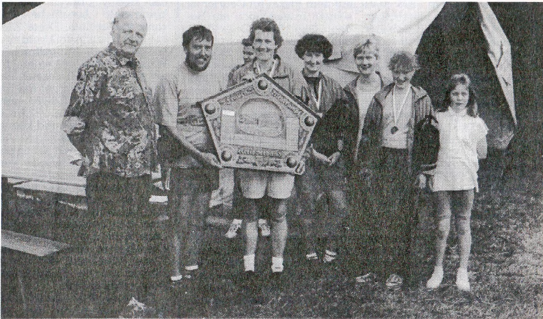
Der Frauen-Wanderpokal ging an Gastgeber „Lat hüm susen“ Blersum.